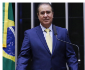
EFICIÊNCIA DA GESTÃO E POLÍTICAS PÚBLICAS Jonas Donizette PSB - SP