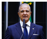
SECRETÁRIO-GERAL | DEPUTADO Júlio Lopes PL - RJ