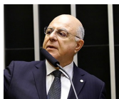
PRESIDENTE Arnaldo Jardim Cidadania - SP