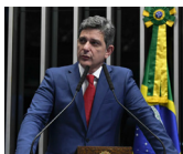
VICE-PRESIDENTE DO SENADO Rogério Carvalho PT - SE