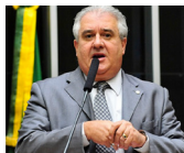
CRÉDITO Augusto Coutinho de Melo Republicanos - PE