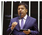
EDUCAÇÃO E EMPREGO Mendonça Filho União - PE